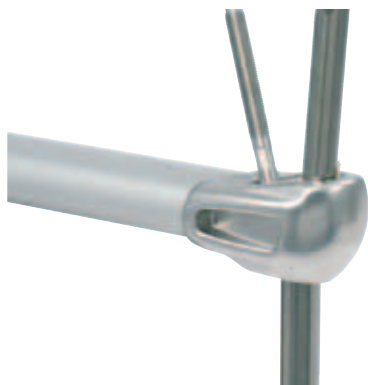
Spridarnock för länkad rigg (fr.o.m. 2008).