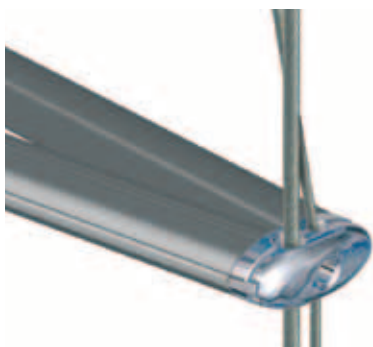
Spridarnock för V-spridare.