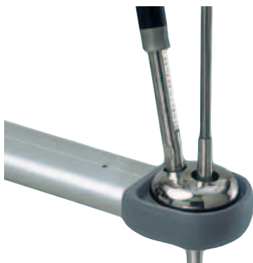
Spridarnock för rodrigg (Tip-cup).

Spridarnockarnas design varierar beroende på riggtyp, antal spridare samt om den stående riggen är länkad eller kontinuerlig.