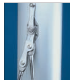
Ferrure traditionnelle double.