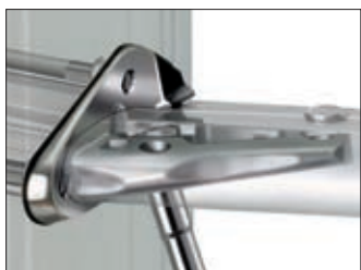
Sections C et sections F. Bas-hauban fixé au support de barre de flèche.

La ferrure permettant de recevoir l'embout à boule des bas haubans ou des intermédiaires est intégrée dans les platines de barre de flèche. C'est une solution solide et résistante. La ferrure pour embout à boule intégrée réduit le nombre de pièce rapportées au mât, ce qui en fin de compte donne un mât plus léger. Pour plus d'informations, voir page 45.