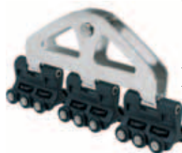
Toppbeslag, Art. nr. 511-730-06. Art. nr. 511-731-06 (HD)