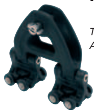
Toppbeslag, Art. nr. 511-702-04.