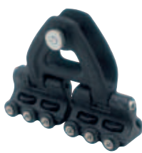
Toppbeslag, Art. nr. 511-701-04. Art. nr. 511-717-06 (ALU)