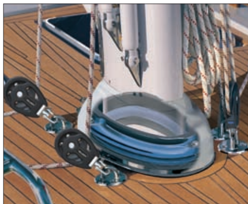
Le passage du mât à travers le pont est fermé hermétiquement par un robuste "O ring" et bloqué verticalement entre deux anneaux d'étambrai. L'anneau inférieur est boulonné de façon permanente au pont et est facile à installer. Une fois en place il permet un déplacement suffisant du mât dans les différentes directions.