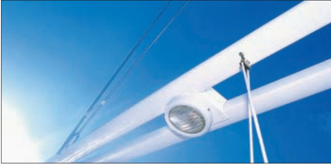
Barres de flèche en V avec projecteurs intégrés.