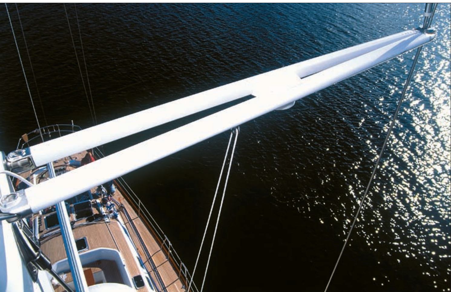
Mât enrouleur de 32 mètres pour voilier de 70'.

Les barres de flèche en V constituent un élément essentiel de l'esthétique des mâts Seldén pour bateaux de 40 pieds et plus. Nous pensons que ce qui est beau fonctionnera bien à bord et vice versa. Les barres de flèche en V sont un exemple typique du design fonctionnel qui caractérise tous les mâts Seldén.