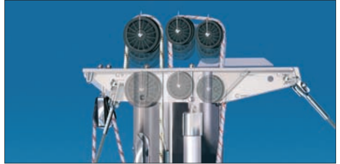
La tête de mât intègre un grand nombre de spécificités. Les réas et les axes peuvent être remplacés sans enlever ni l'étai ni le pataras.